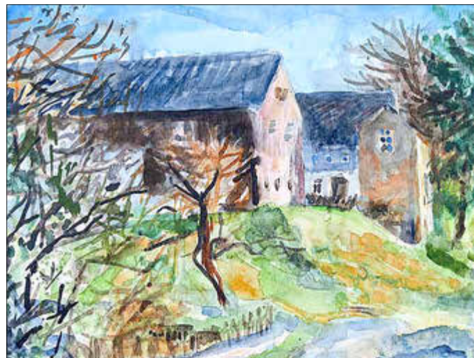
Abendlicht auf Sengebodens Hof Aquarell 2026

seiner Arbeit. Gartenbilder und Stillleben ergänzen diesen Schwerpunkt.