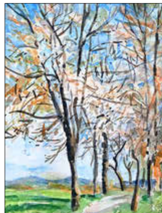
Blühende Kirschbäume bei Polenz Aquarell 2026

Die Sommerausstellung „Jochen Fiedler – Landschaften“ in der Radfahrerkerche auf dem Marktplatz der Stadt Wehlen wird vom 2. Juli bis zum 31. Oktober zu sehen sein. Ergänzend zur laufenden Ausstellung im Stadtmuseum Pirna (bis 5. Juli) werden nach längerer Zeit aktuelle und ältere Aquarelle, ergänzt um einige Ölbilder, den Charakter der neuen Ausstellung bestimmen.