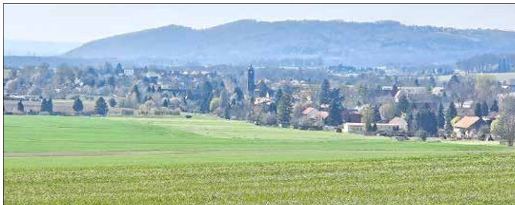
Blick auf die Lohmener Kirche