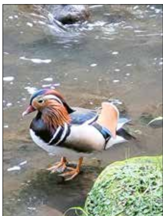
Ein seltener Gast