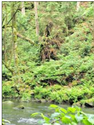
Ein entwurzelter Baum