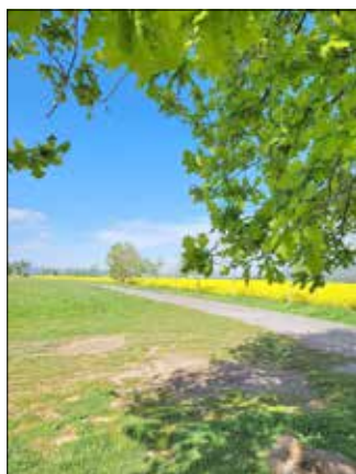
Blick von der Bank in Doberzeit