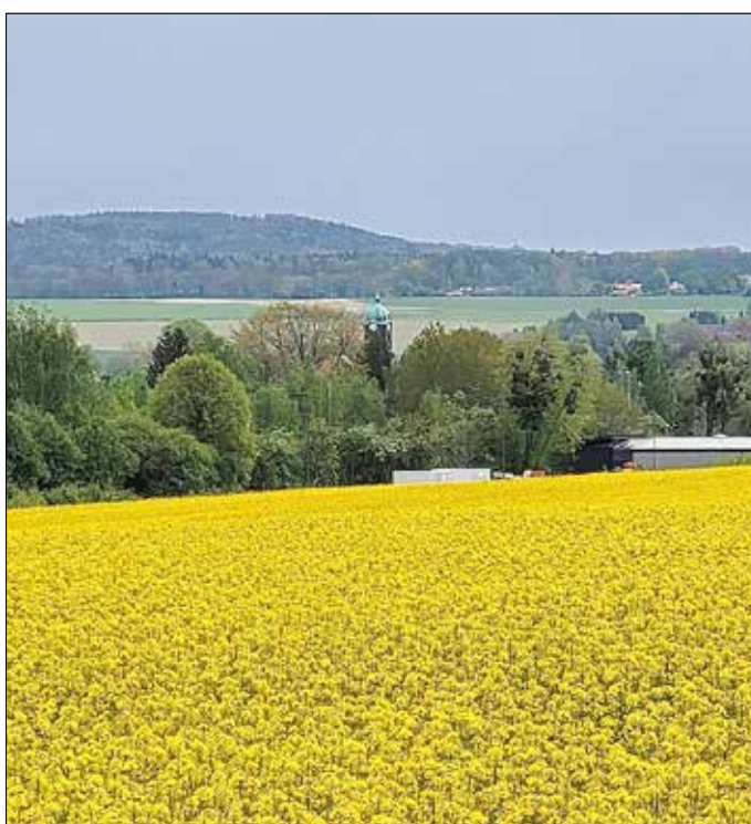
Blick vom Gewerbegebiet zur Kirche