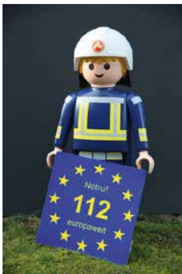
Abbildung 3: Vor dreißig Jahren wurde der Euronotruf 112 beschlossen

Es war dann kein Zufall, dass die deutsche Notrufnummer 112 zum Euronotruf wurde. Die dreistellige Notrufnummer 112 hatte technische Vorteile gegenüber kürzeren Notrufnummern. Und als die Europäische Konferenz der Verwaltungen für Post und Fernmeldewesen CEPT sich Mitte der 70er Jahre für eine Nummer entscheiden musste, war die 112 die Nummer mit der größten Bevölkerungszahl. Auf der Basis dieser Vorauswahl haben am 29. Juli 1991 die EG-Mitgliedstaaten beschlossen, die 112 als gemeinsame Notrufnummer einzuführen. Die Vorteile einer einheitlichen Nummer sind so groß, dass Großbritannien die 112 trotz des Brexits beibehalten hat. Für alle 112-Staaten gilt, dass Anrufende automatisch mit der nächstgelegenen 112-Notrufzentrale verbunden werden.