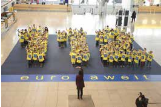
Abbildung 1: 112 Blockflötenkinder werben bei Reisenden am Stuttgarter Flughafen für den Euronotruf 112