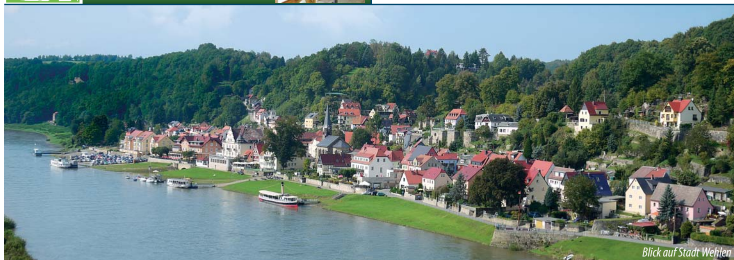
Blick auf Stadt Wehlen

bergsport-arnold@t-online.de · www.bergsport-arnold.de