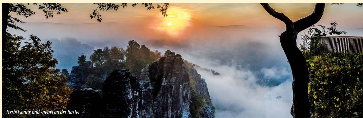
Herbstsonne und -nebel an der Bastei

Weihnachtsmarkt in der Grundschule Stadt Wehlen Weihnachtsmarkt im historischen Ortskern Lohmen Vielseitigkeitslauf des Sächs. Schlittenhundesportvereins in Lohmen Silvesterfeiern in gastronomischen Einrichtungen in Stadt Wehlen und Lohmen