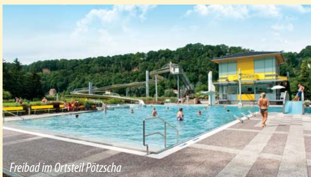
Freibad im Ortsteil Pötzscha