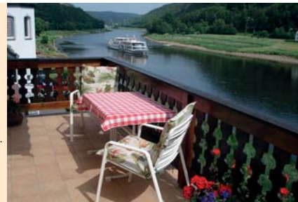
Mehrfamilienhaus mit direktem Elbblick, großer Balkon, Sommerlaube.

Preis pro Tag/Einheit ab 40 € Aufbettung pro Tag 10 €