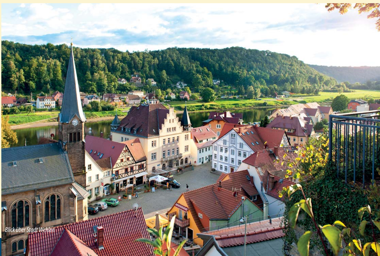
Blick über Stadt Wehlen