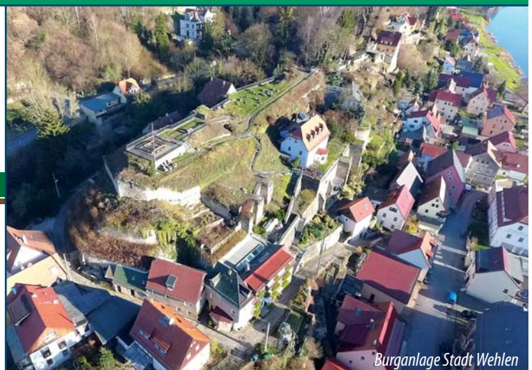
Burganlage Stadt Wehlen