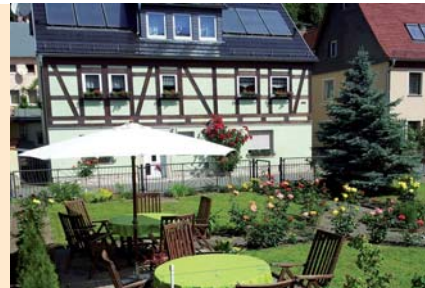
Ruhige Lage im Stadtzentrum, behindertenfreundlich, Sitzecke im Garten mit Blick zur Elbe, Parkplatz, Zustellbett möglich, keine Haustiere.

Preis pro Tag/Einh. 50 m 2 55 € Preis pro Tag/Einh. 40 m 2 35 € Zuschlag Kurz-A. b. 3 N. 20 €