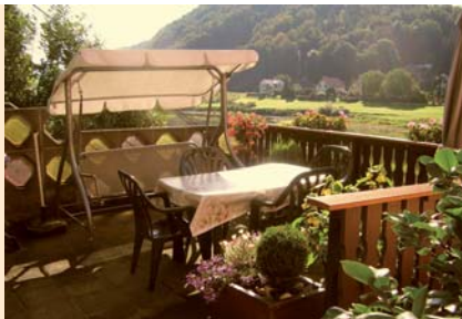
Schöner Elbblick, sonnige Terrasse, kleiner Gartenimbiss auf dem Grundstück.

Preis pro Tag/Einheit 30 € Vermietung ab 3 Nächte