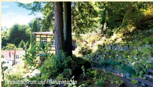
Heimatmuseum und Pflanzengarten