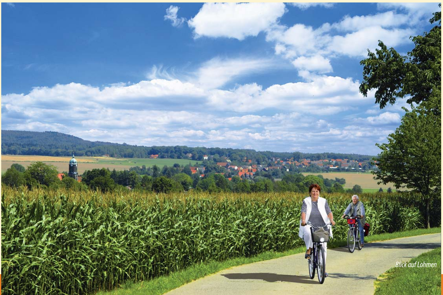
Blick auf Lohmen