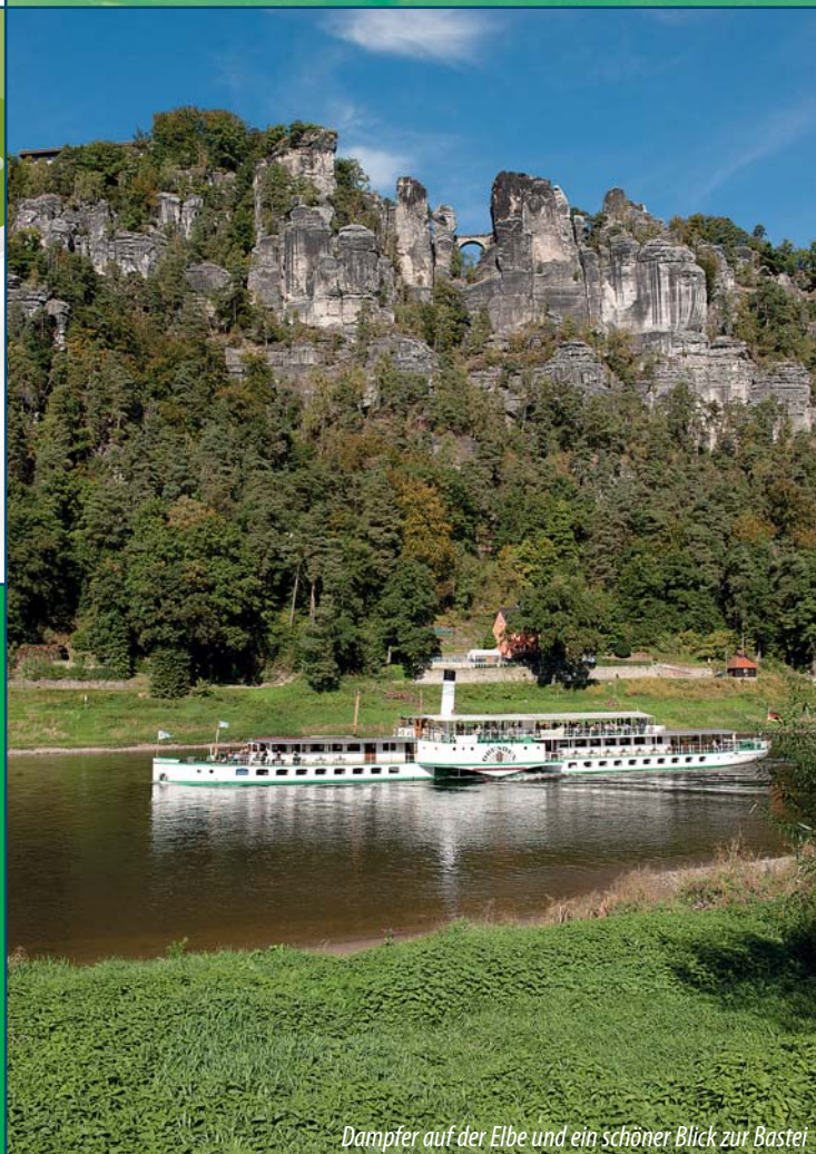
Dampfer auf der Elbe und ein schöner Blick zur Bastei