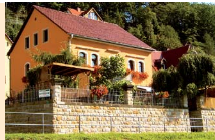
Am Ufer der Elbe, am Elberad- u. Malerweg, liegt unser Haus in ruhiger zentraler Südlage in Stadt Wehlen. Von unserem Grundstück blicken Sie auf die Elbe, das Basteisschiff mit seinen „Weißen Brücken“ und das Wehlstädtl.

Preis pro Tag/Einheit ab 42 € Aufbettung pro Tag 10 €