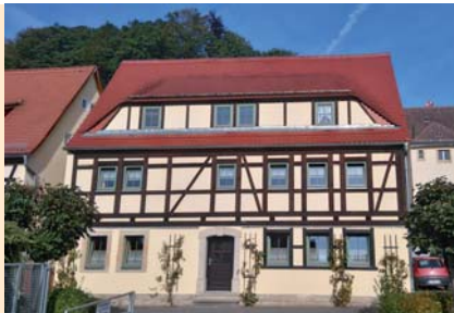
Frühstück und Halbpension nach Absprache möglich. Ruhige Lage in Elbnähe, Aufenthaltsraum. 1 Ferienhaus für Wanderfreunde auf dem Weg zur Bastei vorhanden.

Preis pro Tag/Einheit ab 32 € Zuschlag Kurz-A. b. 3 N. 15 €