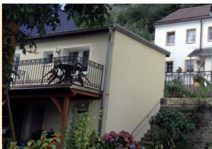
Balkon mit traumhaftem Blick auf die Elbe, kleiner Gartenimbiss im Nachbargrundstück, Wohnraum mit Küchenzeile.

Preis pro Tag/Einheit 35 € Zuschlag Kurz-A. b. 2 N. 15 €