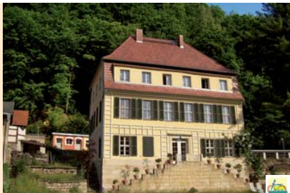
Das historische Herrenhaus bietet Ihnen Nostalgieferien in herrschaftlichen Ambiente. Im farbenfrohen Nebengebäude befinden sich 3 Zimmer mit Freisitz. Unser Haus liegt direkt an der Elbe mit Panoramablick, Liegewiese, Garten u. Grillplatz.

Preis p. Tag/Einh. FeWo ab 75-130 € Preis pro Pers. Zimmer ab 19 € Preis pro Pers. Frühstück 9,50 €